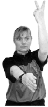
Exclusion de 2 minutes